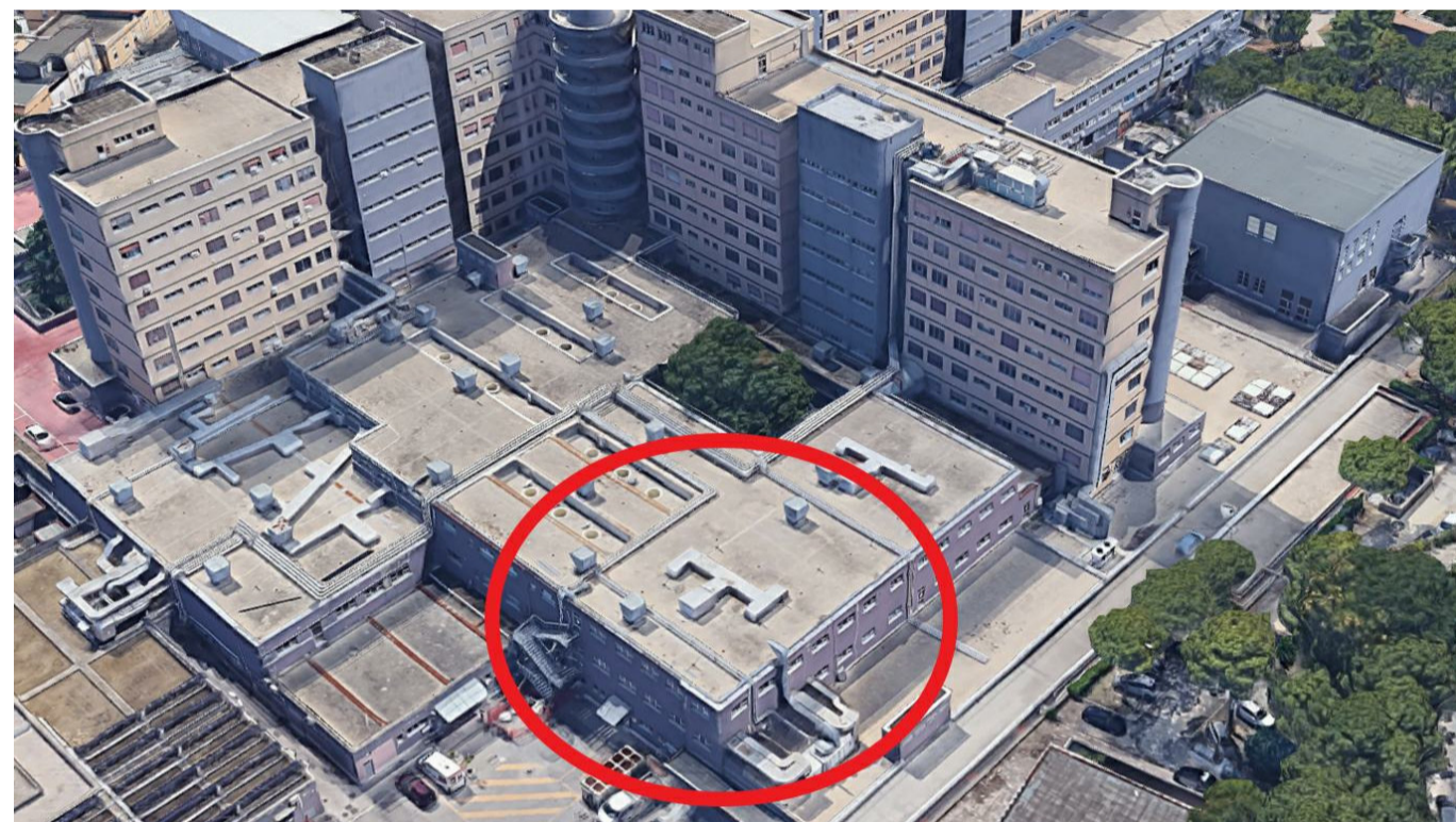
P.O. Santo Spirito di Pescara Ricostruzione 3D satellitare