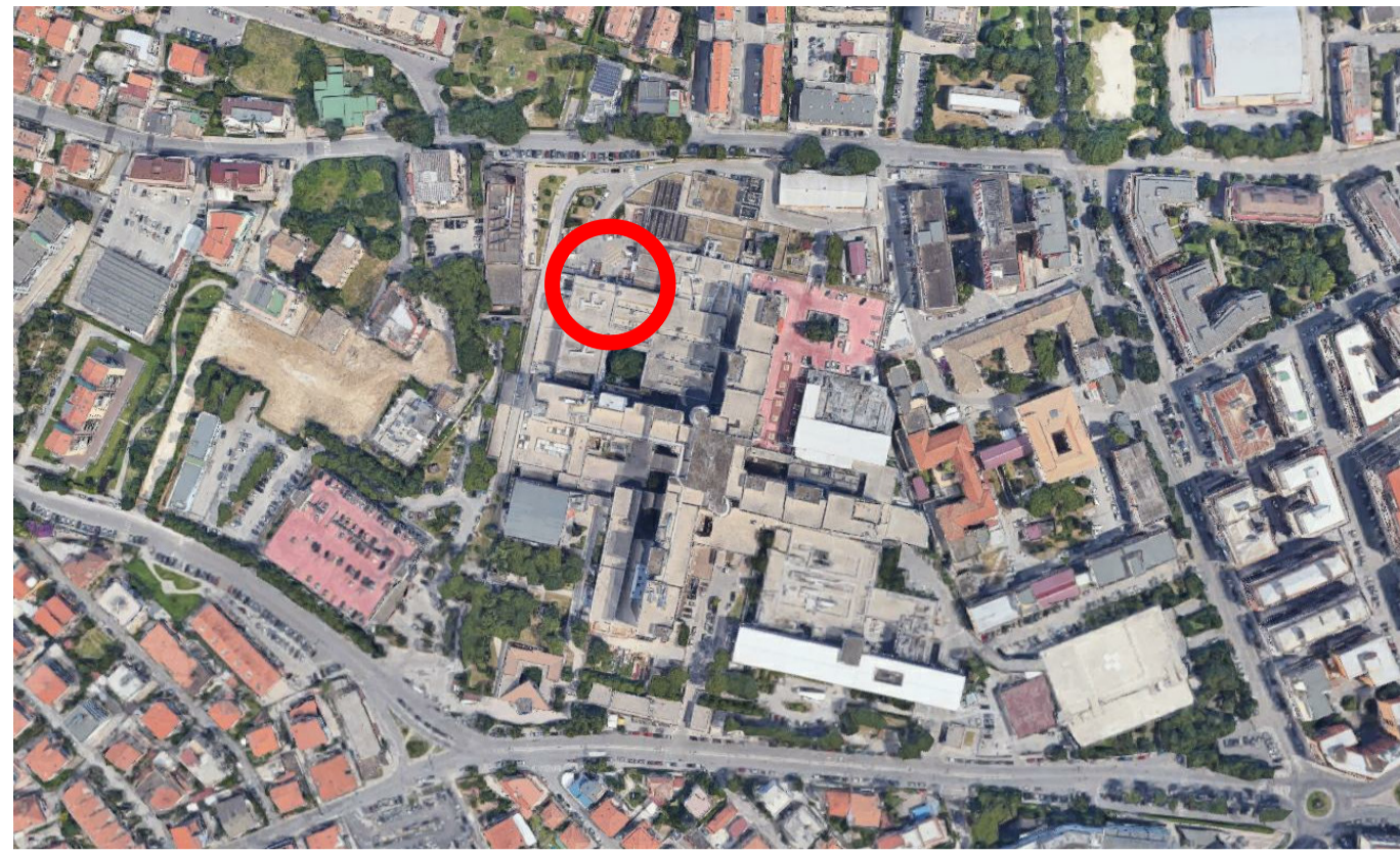
P.O. Santo Spirito di Pescara Immagine satellitare